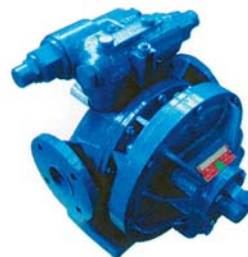
Dwukierunkowy zawór bezpieczeństwa