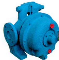
Pompa z płaszczem grzewczym