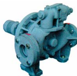
Wykonanie wysokotemperaturowe HT